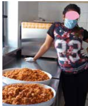
Una mamma ospite che ha cucinato un piatto tipico senegalese

L'immagine ci ricorda che proveniamo tutti dalla stessa Madre, come ci dice Papa Francesco nella sua enciclica, tutti uniti come fratelli, spronandoci a costruire ponti anziché muri; valore che è alla base del nostro agire quotidiano in Casa di Accoglienza. Anche se non è sempre facile la convivenza a causa di differenti culture o di caratteri diversi, le nostre mamme fanno quotidianamente un esercizio pratico di fratellanza e vicinanza, incoraggiate e sostenute dalle educatrici e volontari.