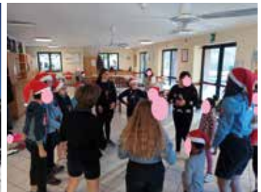
Attività con gli scout in Casa di Accoglienza