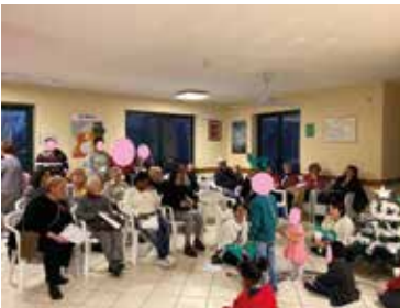
Volontari alla festa di Natale