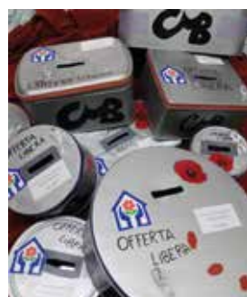
Nuove scatole delle offerte fatte dalle nostre mamme