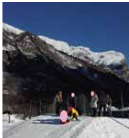
Gita a Riva Valdobbia