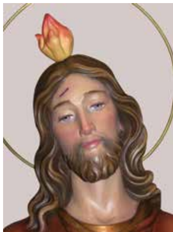
S. Giuda Taddeo

Questa preghiera può essere uno dei passi di guarigione del dolore che l'aborto lascia... Può generare un nuovo sguardo sul ricordo, sul legame ineliminabile con il proprio figlio in Cielo.